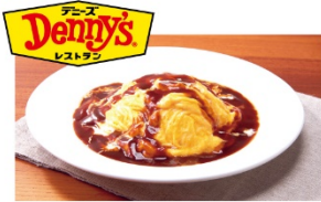
とろ〜り卵とチーズのオムライス ¥900 ⇒ ¥600*