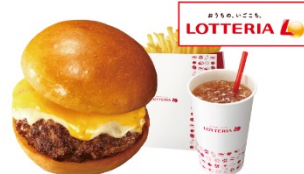
【セット】絶品チーズバーガー ¥990 ⇒ ¥690*