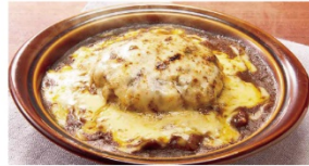
ハンバーグカレードリア ¥900 ⇒ ¥600*