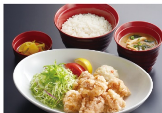
若鶏の唐揚げ弁当