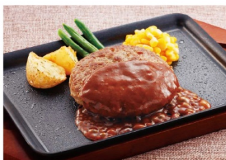
チーズインハンバーグ弁当