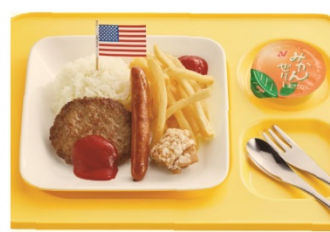
キッズハンバーグ弁当