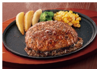
ペッパーハンバーグ弁当