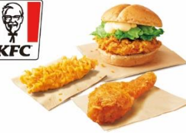
お届けサンドセット ¥850 → ¥550*