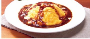
とろ〜り卵とチーズのオムライス ¥900 → ¥600*