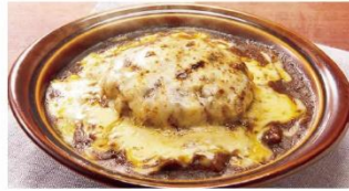
ハンバーグカレードリア ¥900 → ¥600*