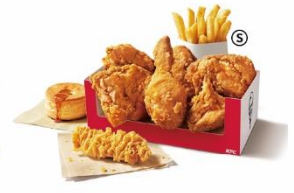
お届け6pcパック ¥1,920 → ¥1,620*