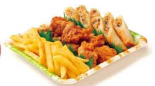
バラエティトリオ 1,850円