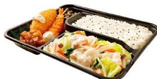
Dx野菜炒め弁当(塩) 1,170円