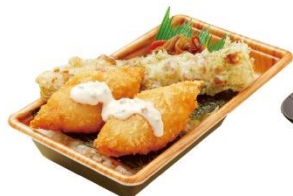
タルタルのり弁当 500円