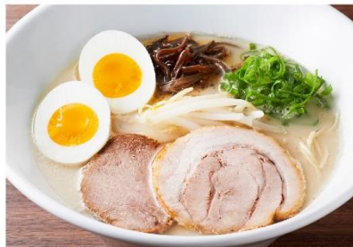
博多豚骨ラーメン (玉子のせ)