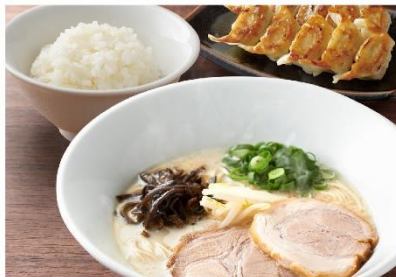
博多豚骨ラーメン +ごはん+餃子 セット