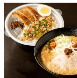
嵐げんこつらあめん RX (醤油・味噌・塩) 餃子3個・ぶためしセット 1,360円