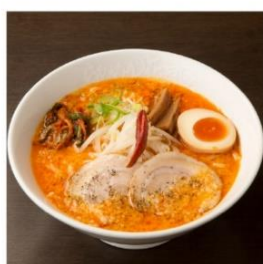
嵐げんこつバリ辛 らあめん塩 RX 1,040円