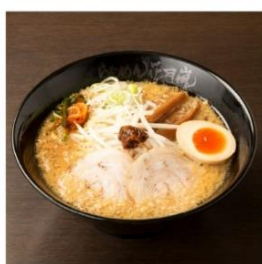
嵐げんこつらあめん RX 890円