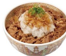
おろしポン酢牛丼 700円