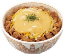
3種のチーズ牛丼 730円