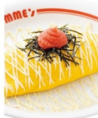
明太子マヨネーズ オムライス SSサイズ 1,310円 Sサイズ 1,450円