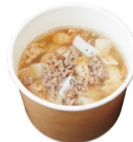
ビーフ&ポークの 贅沢スープ 約300cc 910円

※店舗によってメニューの内容が異なります。 ※価格はすべて税込です。 ※画像はイメージです。