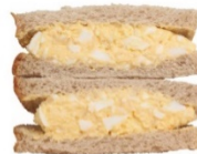
TAMACO サンド 1個 420円