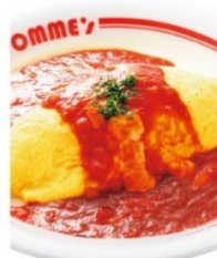
モッツアレラチーズの トマトソースオムライス SSサイズ 1,480円 Sサイズ 1,620円