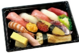
花（はな） 1人前 4,700円