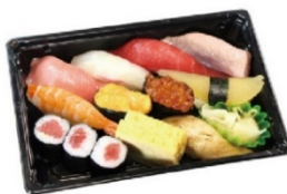
月（つき） 1人前 3,800円