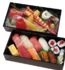
寿司と刺身の 贅沢ざんまい 5,600円