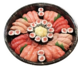
まぐろづくし 3人前 13,500円