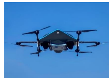
実証実験に使用された日本発物流専用ドローン“AirTruck”