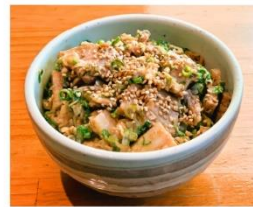
ミニチャーシュー丼 400円